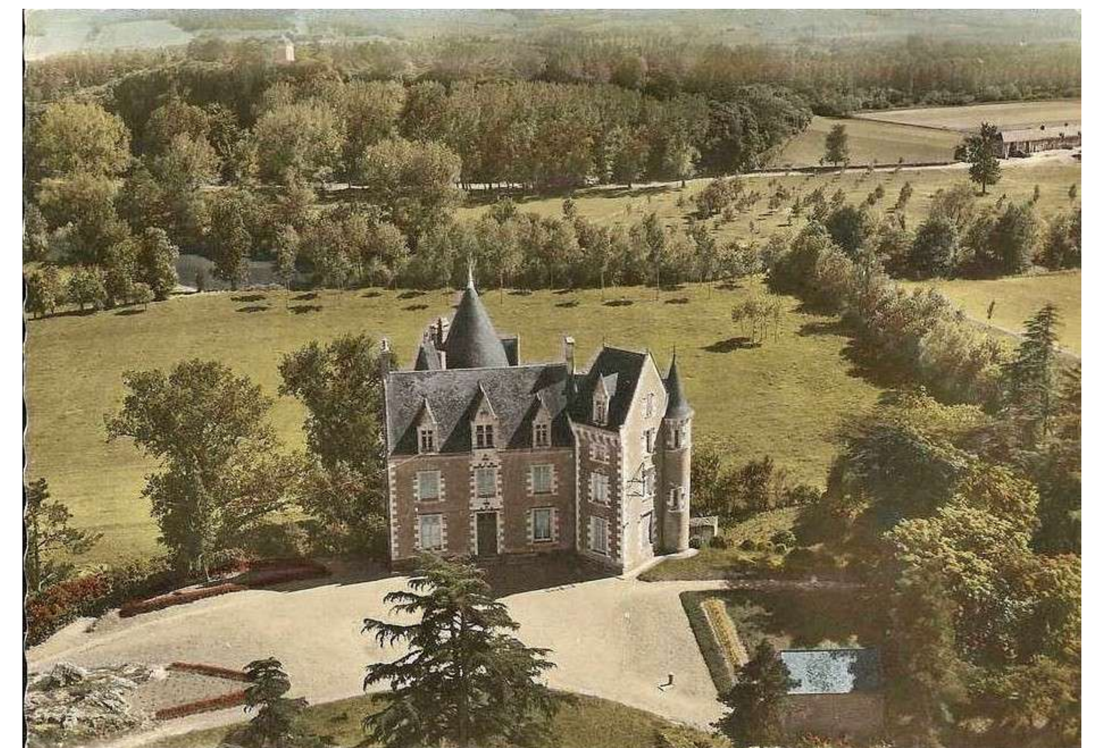
Château de Saint-Symphorien dominant le pré à l'arrière en bordure du Louet, qui recevra, dans les années 1960, le premier parcours de golf de l'Anjou.