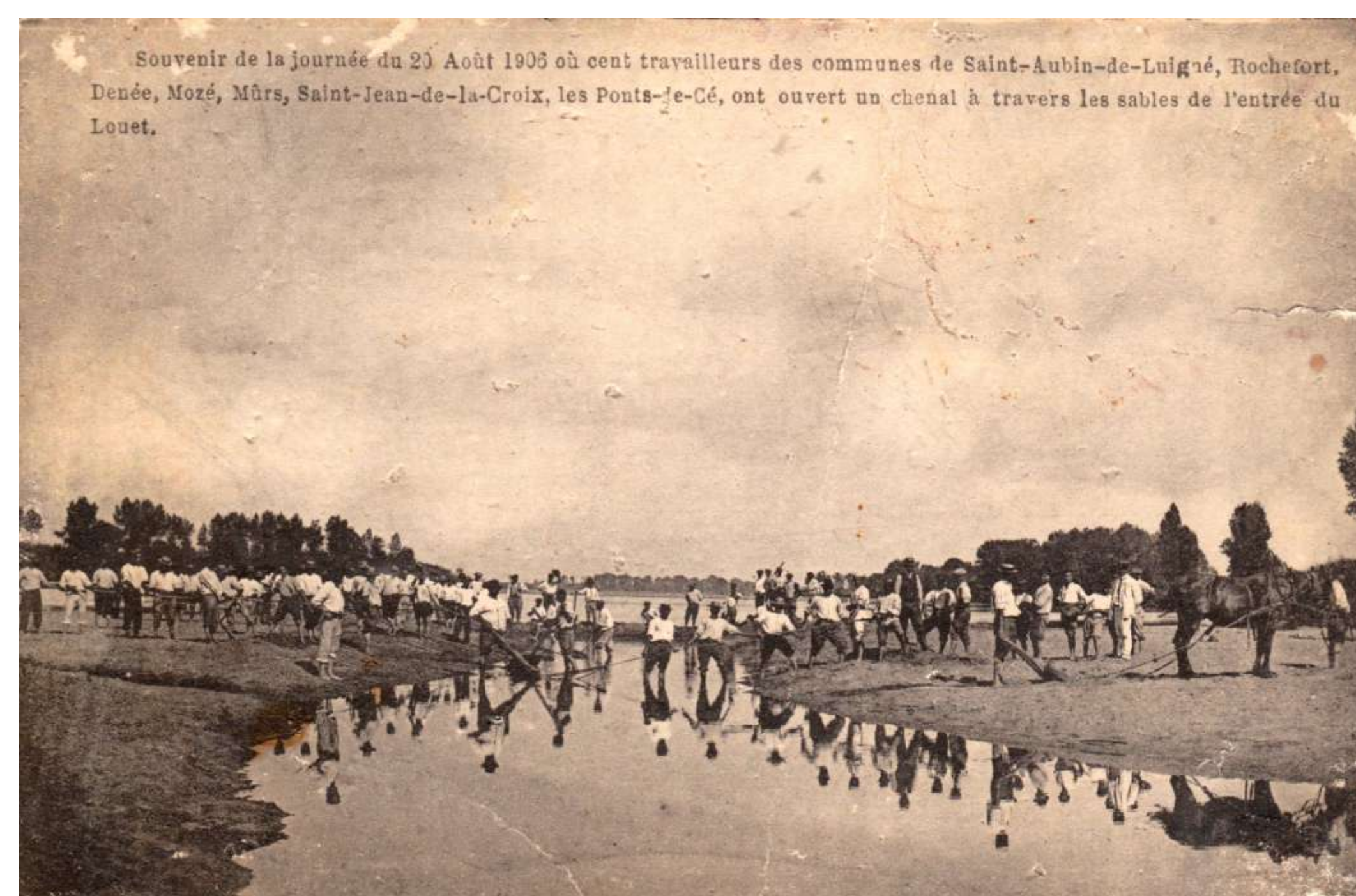
En 1906, déjà!, pour éviter que la rivière ne se retrouve à sec, des volontaires de Rochefort, Saint-Aubin, Dénée, Mozé... se retrouvent à Juigné pour creuser l'embouchure du Louet. Les chevaux et les pelles remplacent les outils modernes.