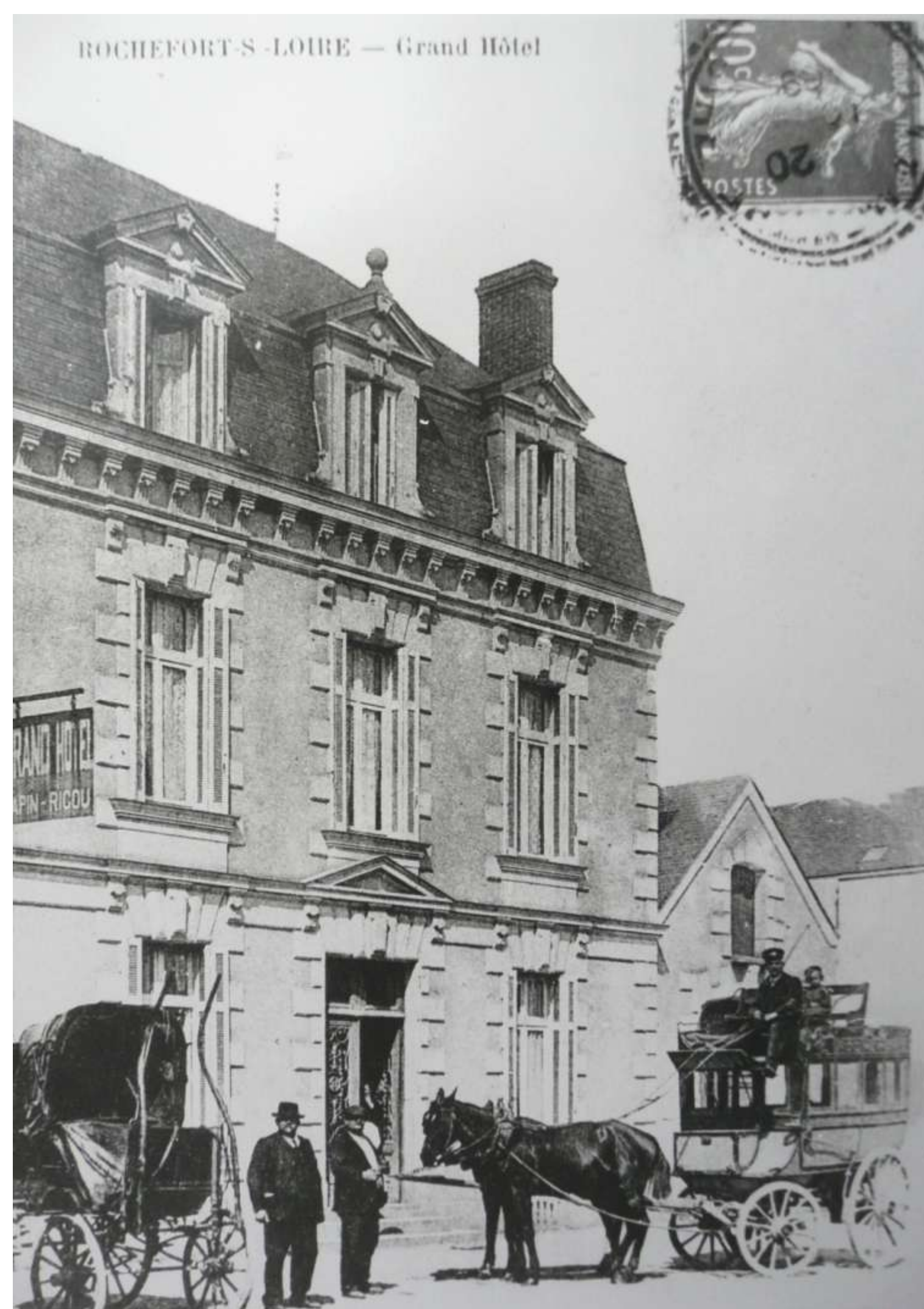
Véhicules hippomobiles stationnés devant le Grand-hôtel