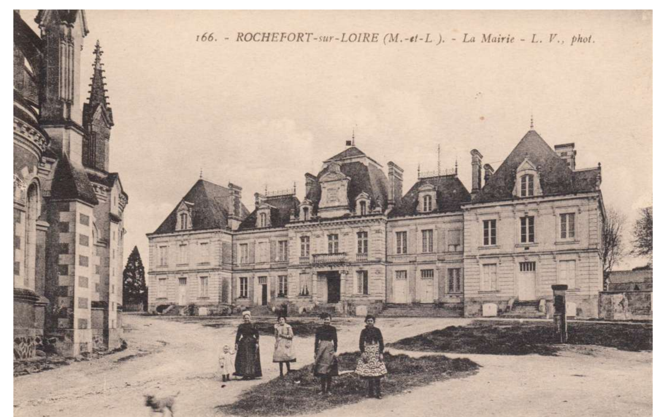
Majestueuse construction de 1870, l'Hôtel de Ville accueille les services de la mairie, les écoles et des logements d'instituteurs. Le fronton porte la date de construction et le blason, modifié, de la famille Saint-Offange. La place ne recevra le bitume que beaucoup plus tard.