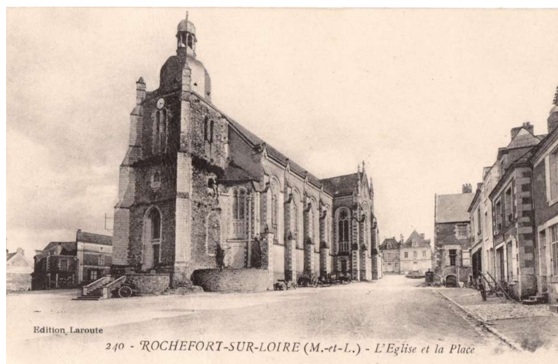
La Place de l'Eglise au début du 20ème siècle. Le stationnement des charrettes et autres outils agricole n'y est pas interdit.