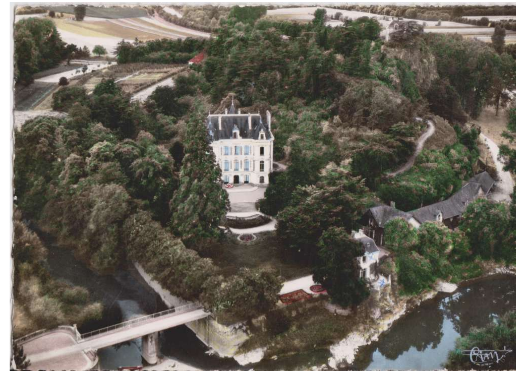
Le château de Dieusie dans son écrin de verdure entre le Louet et les Fossés Verrons. C'est la famille Lardin de Musset, la sœur du poète qui le fera construire au milieu du 19ème siècle.