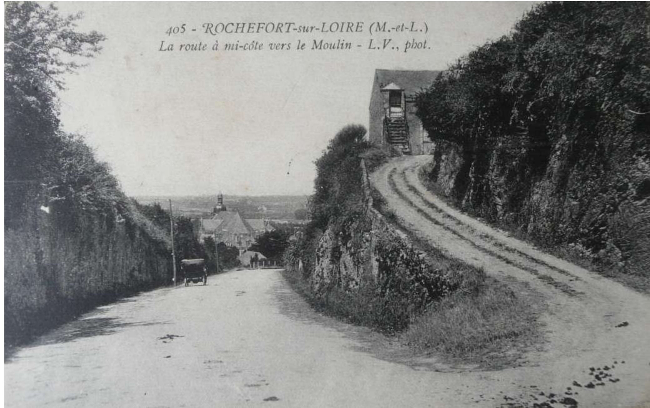
Descente sur Rochefort par la côte de la Croix-Blanche. A droite, le chemin d'accès à Sainte Catherine.