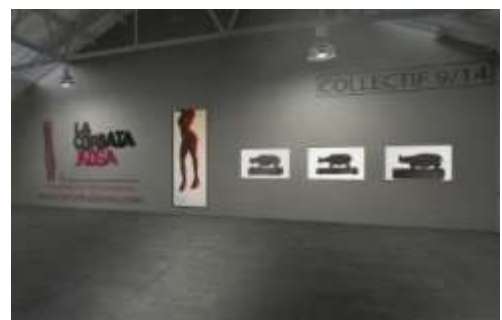
Ci-contre : Collectif 9/14, exposition virtuelle, 2014.

Une application 3D a ainsi été intégrée au site de la galerie de 2013 à 2017. Elle a permis de présenter plusieurs expositions virtuelles, regroupant des artistes qui n'avaient jamais eu l'occasion d'exposer ensemble en utilisant le support numérique comme une nouvelle force de proposition artistique. Les nouvelles orientations du numérique ont cependant rendu, depuis 2017, cette application inutilisable pour le grand public, mais des versions vidéos de ces expositions restent accessibles sur la chaîne de la galerie.