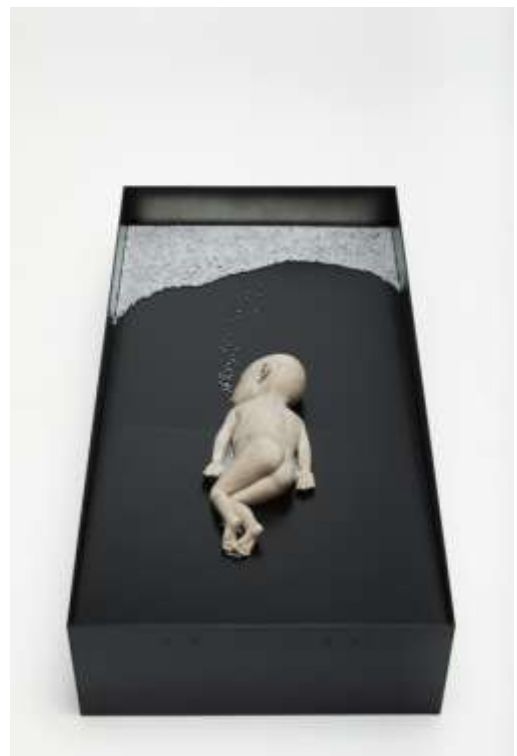
Ci-dessus : Antoine Birot, l'enfant et la mer, installation, 2019.

Antoine Birot veille sur toutes les étapes de la création, depuis la forme en bois, l'empreinte, le moule, le coulage en cire, la cuisson, le coulage du bronze jusqu'aux ultimes finitions.