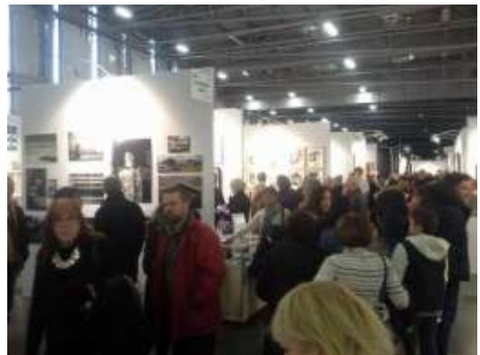
Ci-contre : La corbata rosa au Salon international d'art contemporain de Nantes.

Créée en 2013, la corbata rosa est une galerie d'art actuel dont l'objectif est de favoriser l'acquisition d'œuvres d'art actuel par le grand public et les professionnels. Elle présente des artistes vivants, déjà connus et exposés, afin de diffuser et commercialiser leurs travaux dans le cadre d'expositions temporaires, permanentes et sur internet.