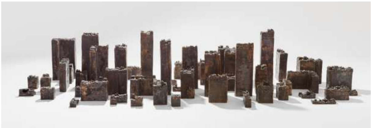
Ci-dessus : Antoine Birot, Cité, sculpture bronze, 2018.

Antoine Birot est un artiste angevin, né en 1974, qui vit et travaille à Rochefort-sur-Loire. Formé dans un premier temps à la musique, sa production artistique s'est ouverte progressivement à de nombreux champs de création. Il aborde par ses travaux aussi bien la sculpture, la performance, l'installation, la vidéo, que la conception de spectacles ou de musiques de films.