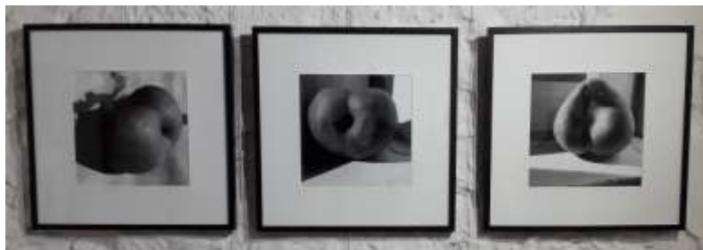
Ci-dessus : Yves Orillon, 3 études photographiques : Pour tenter de répondre à la délicate question du genre..., tirage numérique 30x30cm sur papier baryté satiné, encadrée 50x50cm, 2018.

Après avoir étudié aux Beaux-Arts d'Angers de 1958 à 1963, sa carrière l'a amené à exposer notamment à Paris, Londres, Tours ou encore Angers, mais également à se produire sur scène en tant que musicien. Il a également contribué à la scénographie d'expositions d'autres artistes.