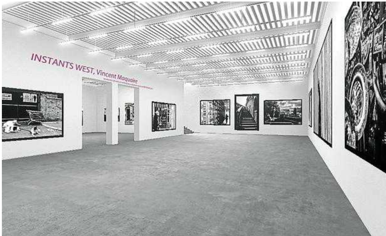
La galerie qui tisse sa toile WWW.LACORBATAROSA.COM

Créé le 27/11/2013 à 07h33 -- Mis à jour le 27/11/2013 à 07h33